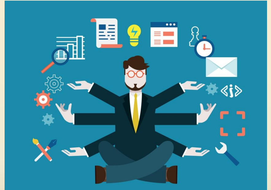
Animador del Lenguaje & Cultura