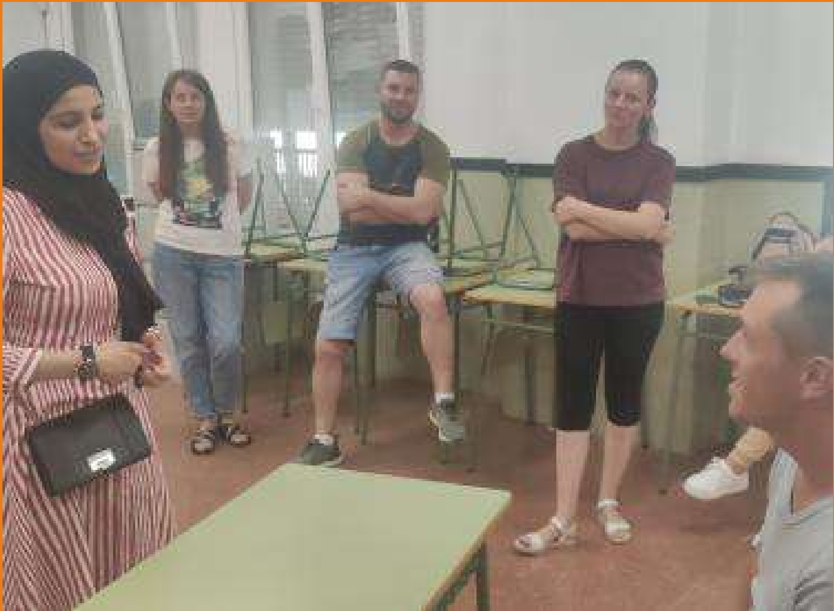
Foto: Trabajos de compromiso de BRIDGE en Valencia, España