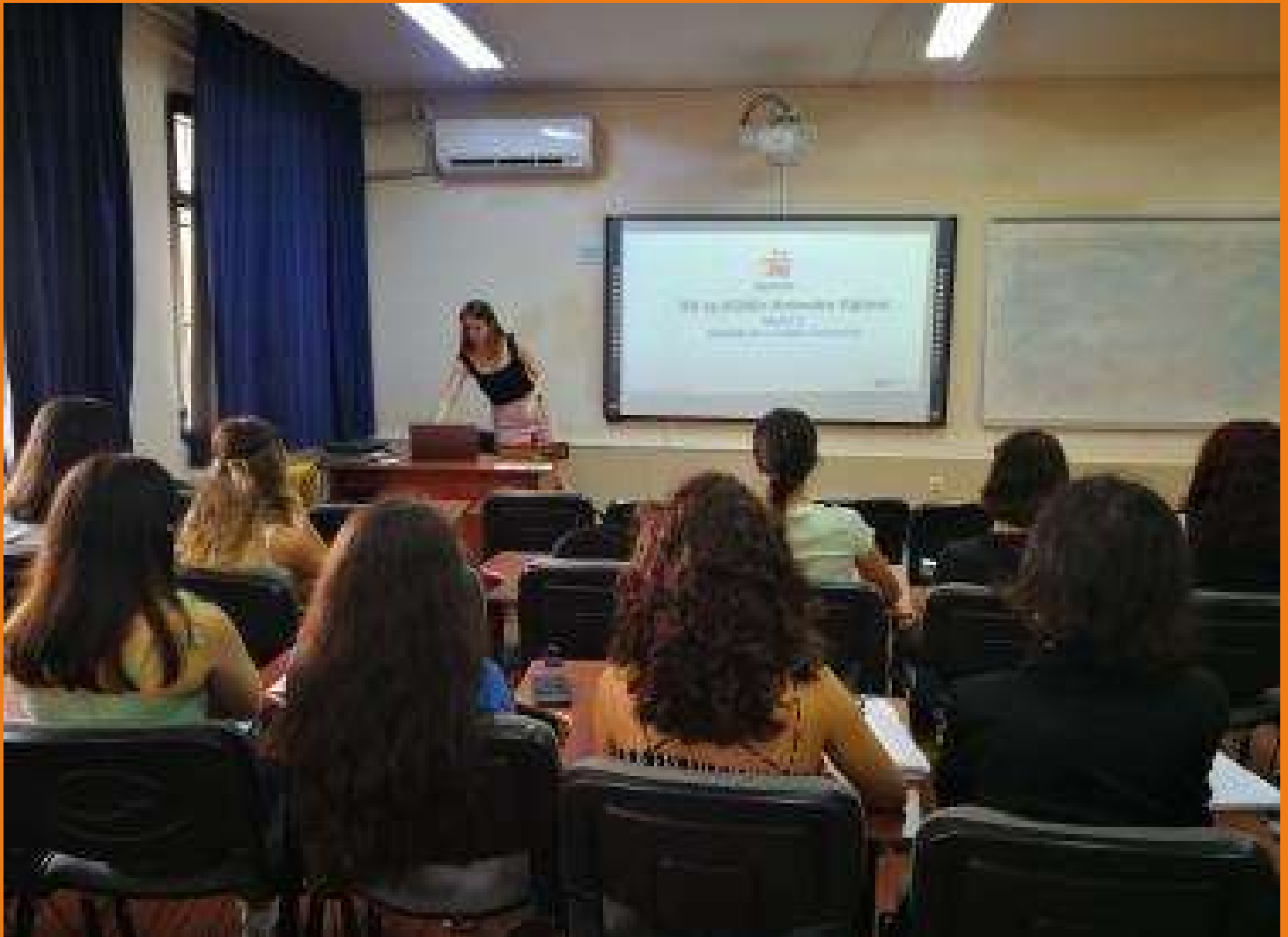
Foto: Corso di formazione BRIDGE per L&CA in Adana, Turchia