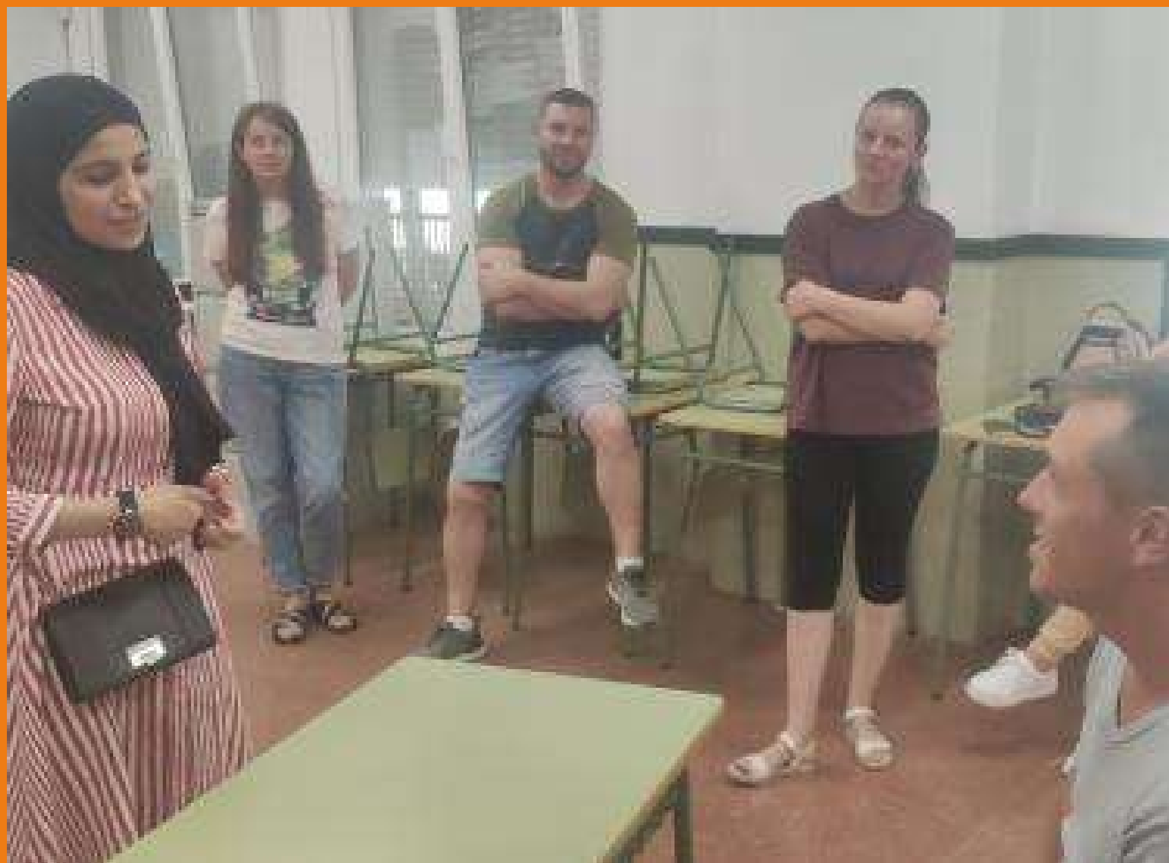
Foto: lavoro di coinvolgimento BRIDGE a Valencia, Spagna